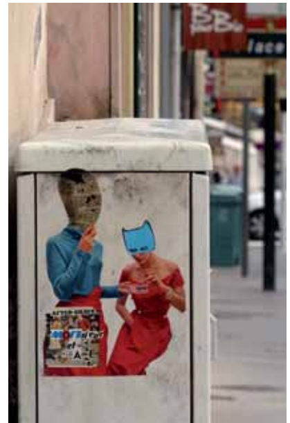
Rue Poincaré