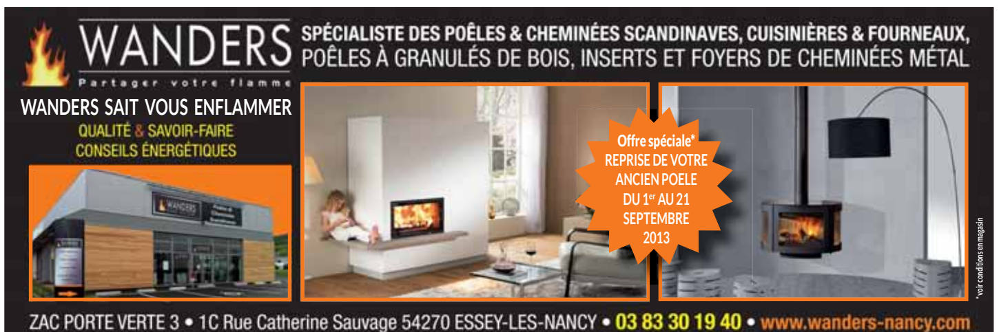
*voir conditions en magasin

Les adeptes du design scandinave connaissent certainement l'outil de conception 3D de la plus célèbre marque de mobilier en kit. Très intuitif, d'une utilisation aisée, il permet de modéliser sa maison avant d'y intégrer les meubles que l'on souhaite acheter. On peut