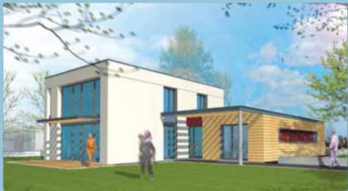
Des maisons très individuelles, réalisées sur mesure, sachant allier, innovation et économies d'énergie. (RT 2012)