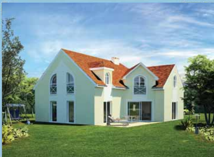
Du suivi personnalisé de l'étude de votre projet à la réception de votre maison, nous sommes présents à chaque étape.