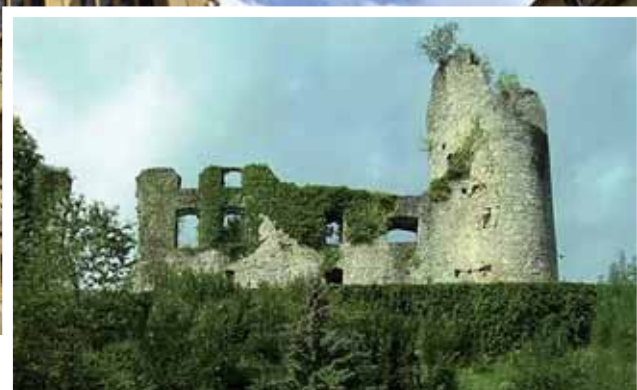
◆ Le château de Frauenberg

Durant deux jours, c'est l'occasion de découvrir secrets des monuments et autres endroits habituellement fermés au grand public. C'est aussi se rappeler que le patrimoine est vivant et qu'une histoire se cache toujours derrière un monument. Prenez la célèbre Porte Serpenoise. Elle a connu bien des vicissitudes. Construite au XIII e siècle, elle est remaniée à plusieurs reprises avant d'être détruite au milieu du XVI e siècle. Elle est reconstruite en 1852 avant