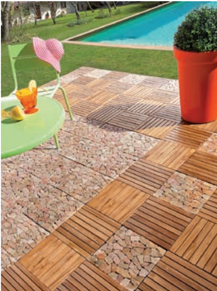
► Dalles acacia huilé Truffaut, 28,95 € le lot de 4 www.truffaut.com