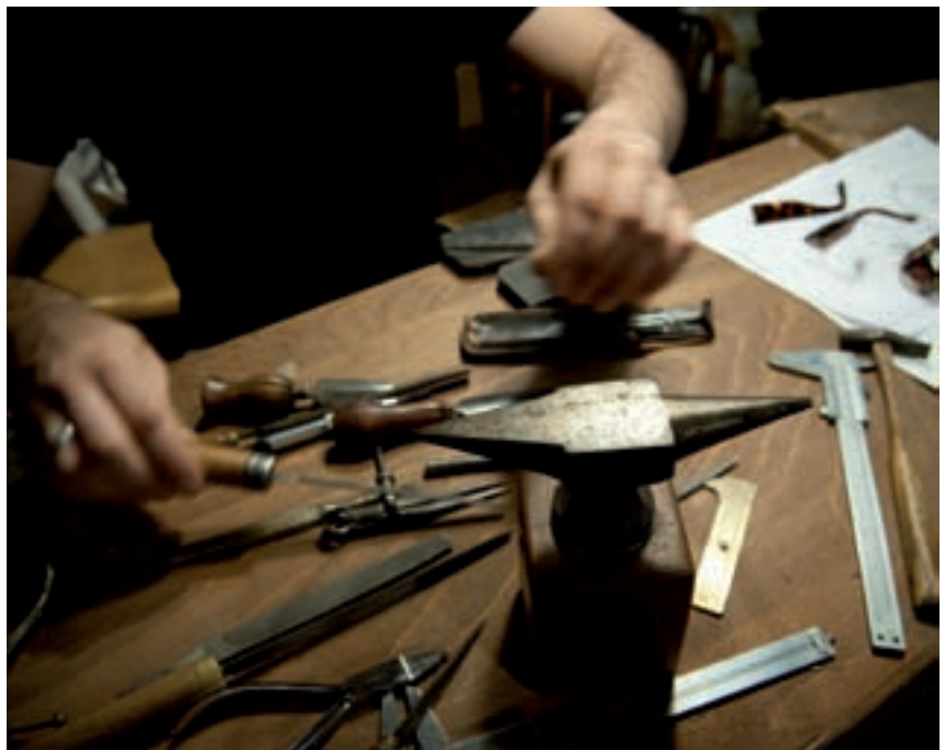
Maison Bonnet, Ecailliste

Trois villes jalonnent ensuite un parcours meusien riche en rencontres et en créations : Commercy , où vous sera présenté au château « l'art du métier », Mouilly avec le Collectif Artspire, qui rappelle que théâtre et performances sont aussi des formes d'art, et Montmédy qui met en avant la restauration du bâti ancien en présentant de la taille de pierre mais aussi les divers cursus de formation pierre. Une voie souvent peu