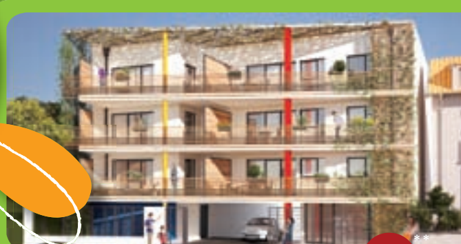
VANDOEUVRE-LES-NANCY Le clos des Arts