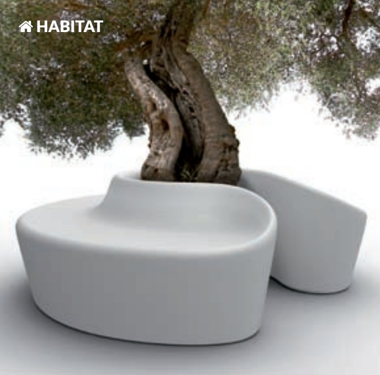
► Banc rond Sardena de Qui est Paul ? 1 825 € - Existe en version lumineuse