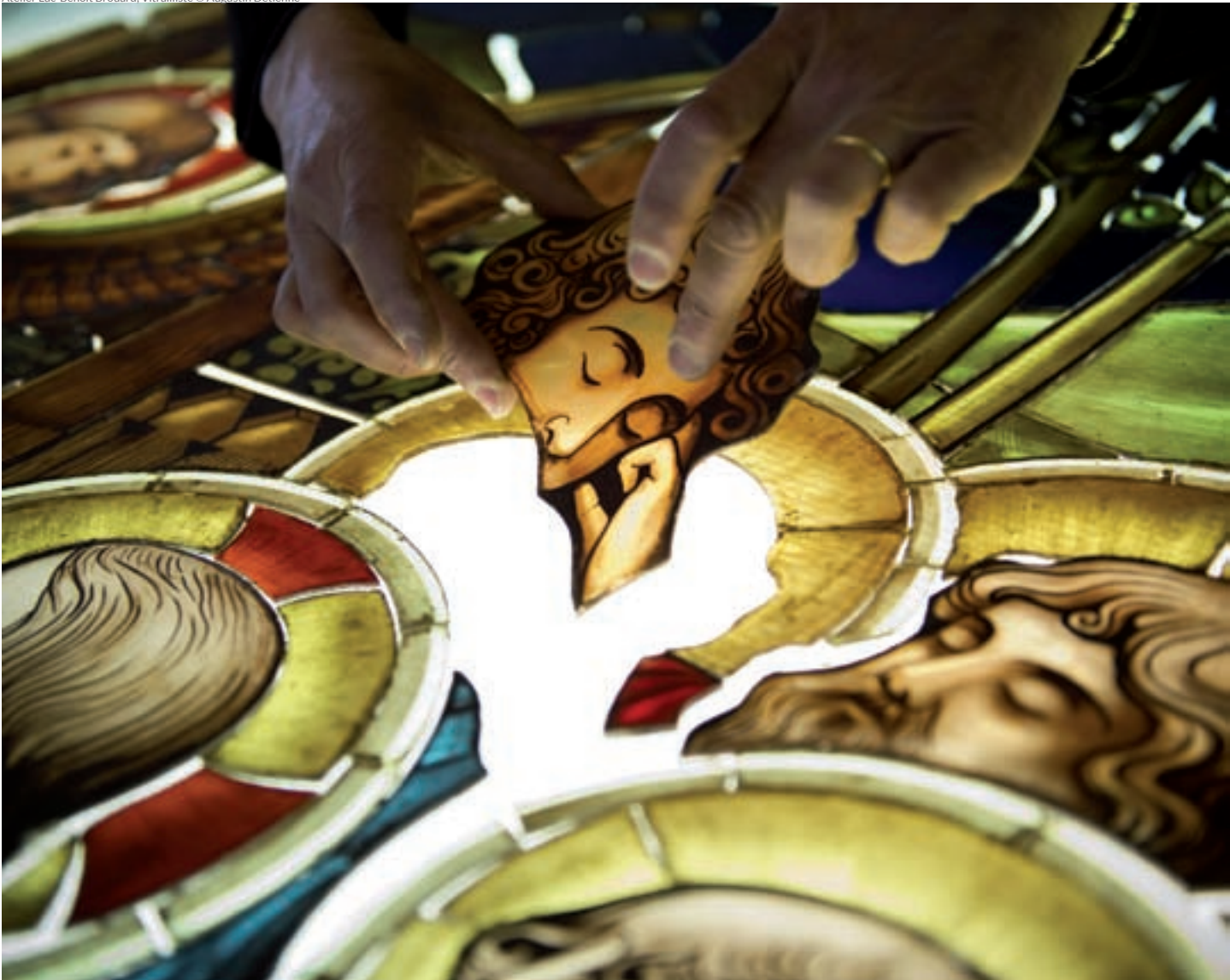
Atelier Luc-Benoit Brouard, Vitrailiste

Plus de renseignements sur : www.journeesdesmetiersdart.eu www.metiersdart-lorraine.org