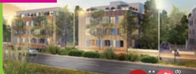
NANCY Le Charme