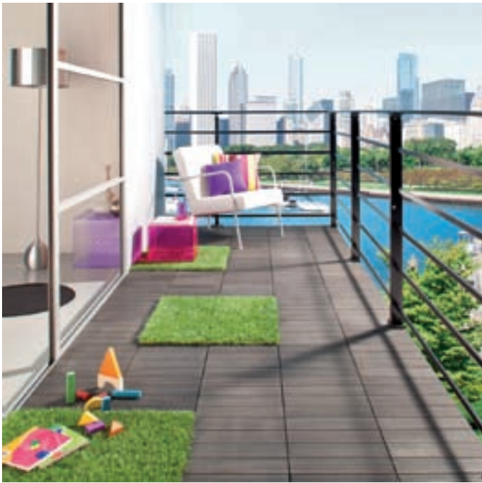
► Dalles gazon confort Truffaut, 28,95 € le lot de 4 www.truffaut.com