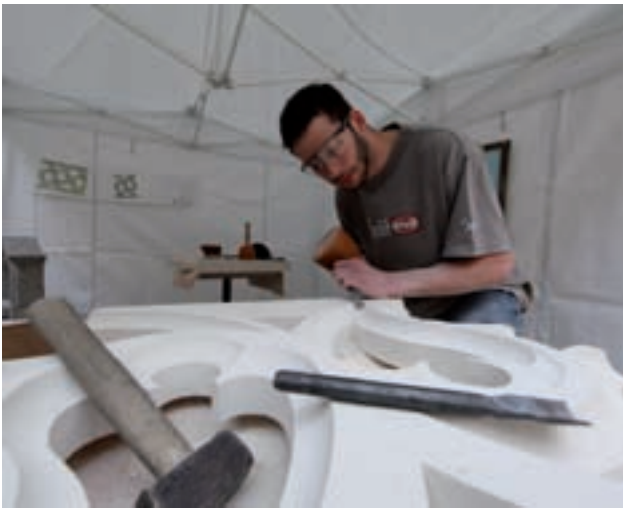
© Botez CRL Pierre LP Claudel

l'Institut Européen des Arts Céramique. Un condensé de talents, un condensé de savoir-faire et de techniques, un condensé de la richesse artistique lorraine.