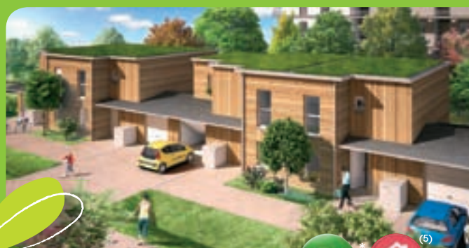
NANCY Jardin de la Haye