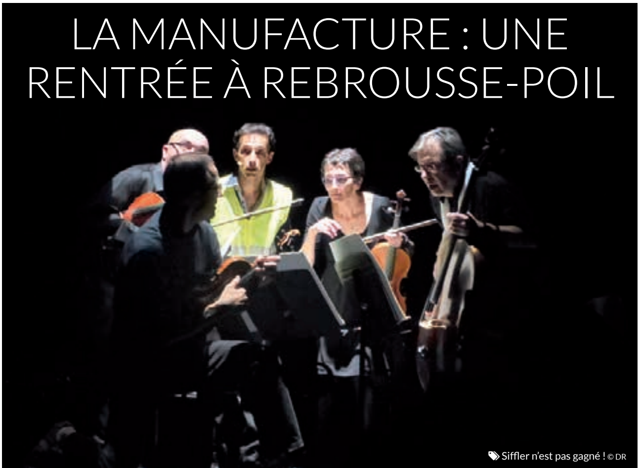
Siffler n'est pas gagné !