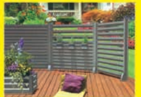
Brise vue CETAL aluminium