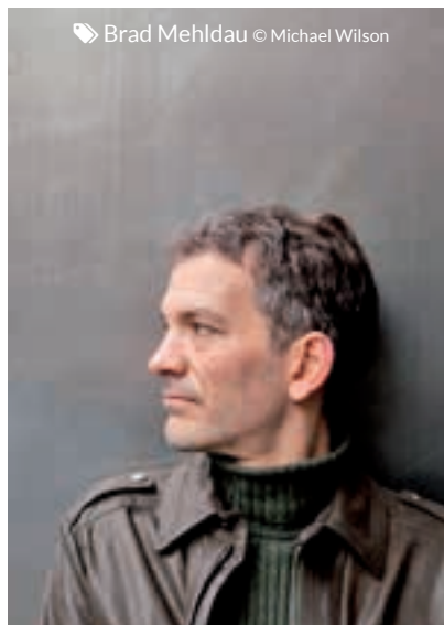
© Brad Mehldau © Michael Wilson

Place donc à la découverte, car aux côtés des scènes principales du NJP, c'est toute une arborescence de concerts qui s'empare de la ville. Des concerts dans des lieux périphériques, c'est la vocation de « Concerts en région » qui propose de Villers-lès-Nancy à Woustviller en Moselle, des programma-