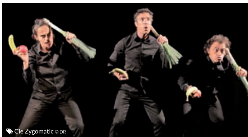
Cie Zygomatic