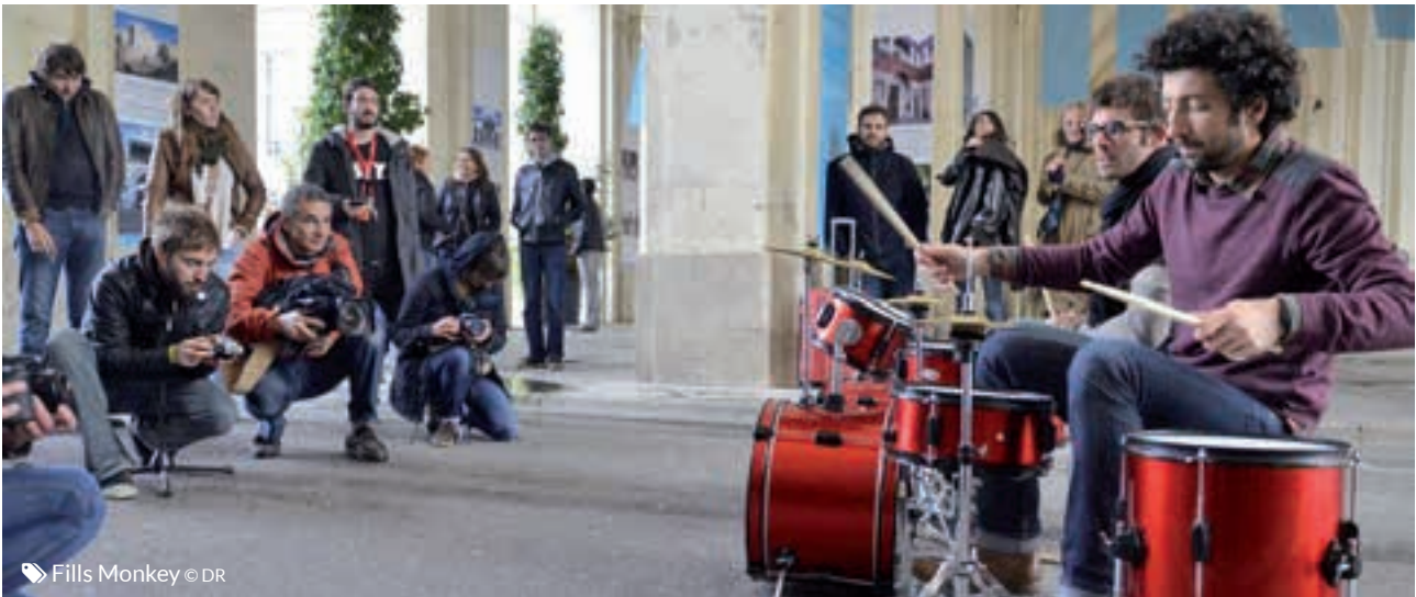
Fills Monkey

aujourd'hui en mesure de mettre en avant nos coups de cœur lors du NJP.»