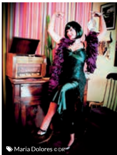
María Dolorès

Plus d'informations sur le programme : epinal.fr , par mail isabelle.sartori@epinal.fr ou par téléphone au 03 29 68 50 23.