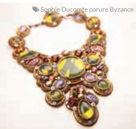
Sophie Ducomte parure Byzance