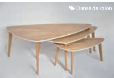
Danse de salon