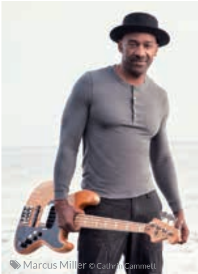
© Marcus Miller © Cathrin Cammett

Autres valeurs sûres dans le registre pur Jazz (le choix est difficile à faire), Avishai