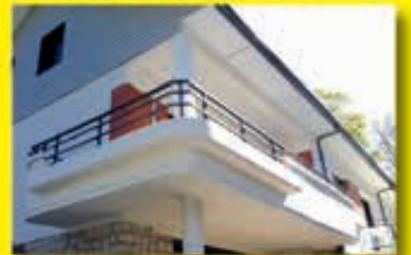
Garde-corps CETAL aluminium