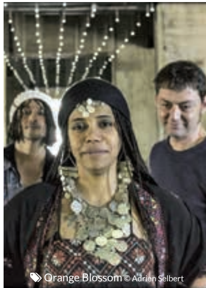
© Orange Blossom © Adrien Selbert