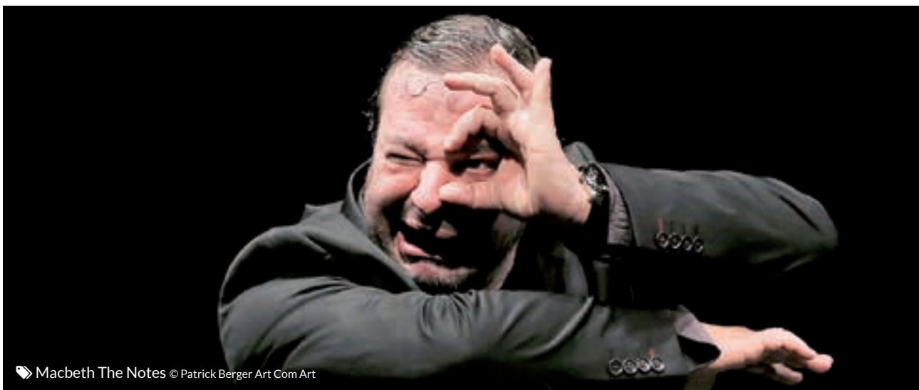
Macbeth The Notes