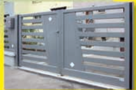
Portail création CETAL aluminium