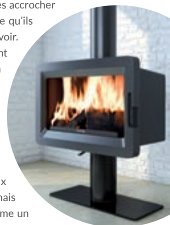
Poêle à bois Titan, 1.199 €

Les cheminées électriques, enfin, tentent elles aussi d'imiter un feu de bois à l'aide d'ampoules LED. Ce chauffage d'appoint propose des puissances de 1 000 ou 2 000 watts. L'aspect décoratif peut également fonctionner indépendamment, la consommation électrique étant alors négligeable. ■ Sidonie JOLY