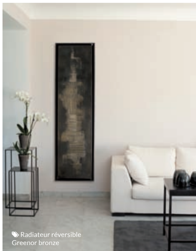
Radiateur réversible Greenor bronze

Vous connaissez déjà les climatisations réversibles. Avez-vous entendu parler des radiateurs qui proposent les mêmes fonctions ? Certains peuvent même être financés par les crédits d'impôt.