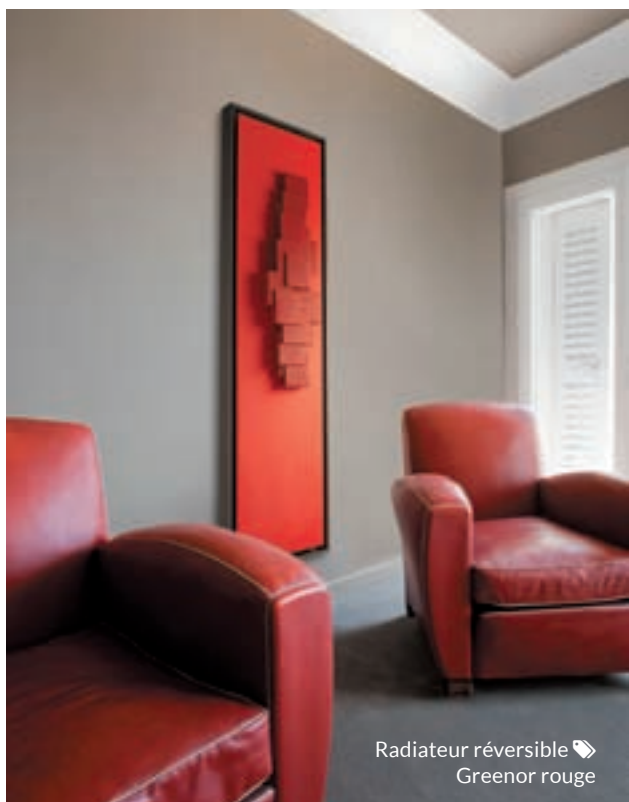
Radiateur réversible Greenor rouge